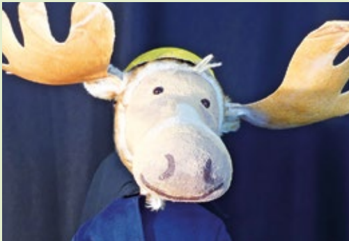
WODO Puppenspiel, Mülheim an der Ruhr Finn, der Feuerelch Sa., 23.03.2019