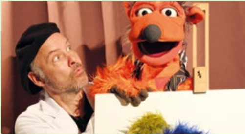
Figurentheater Wolkenschieber, Kasseedorf Geliebter Woffel Sa., 16.02.2019

Die folgenden Veranstaltungen finden jeweils um 15:00 Uhr im VHS-Forum, Uffenstr. 1 statt und sind geeignet für Kinder ab 4 Jahren und die ganze Familie. Der Vorverkauf in der KVHS Norden beginnt ca. 4 Wochen vor dem jeweiligen Stück.