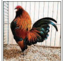
Das Rassegeflügel steht im Mittelpunkt.

Anschließend werden am Freitagabend Vorträge über Rassegeflügel gehalten und diese gemeinsam erörtert. Der Rassegeflügelzuchtverein Norden feiert übrigens im Jahr 2020 sein 150-jähriges Bestehen. Aus diesem Grund werden für die Organisation Vorschläge gesammelt und besprochen.