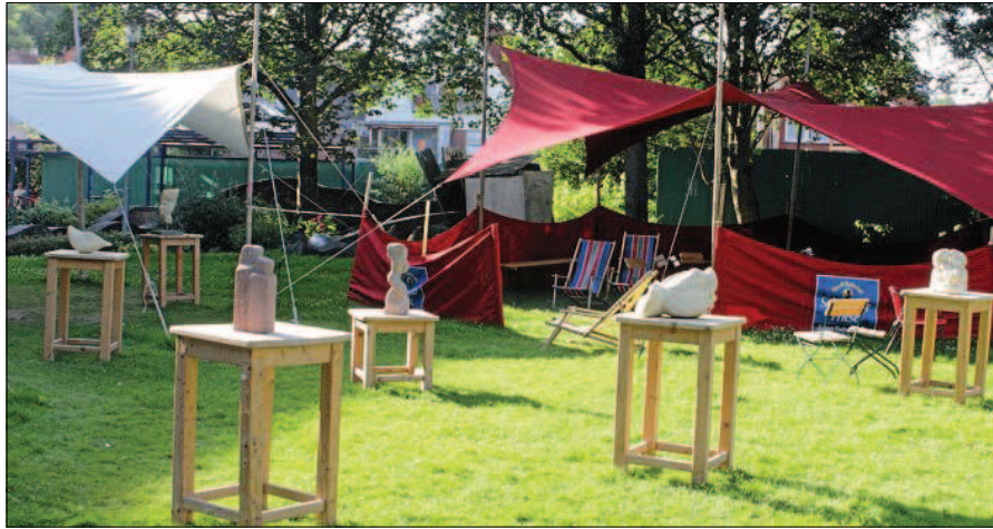
In der Sommerakademie arbeiten die Künstler und Teilnehmer sowohl im Freien als auch in den Räumen der Norder Kreisvolkshochschule.

Auch damit werben die Veranstalter: dass nicht nur die „ganz normalen“ Kurse angeboten werden wie Acryl- oder Aquarellmalerei oder Zeichnen